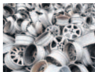
Tausende Alt-Alufelgen landen im Schmelzofen.

Stück für Stück kommt glänzend an. Mit leichtem Rütteln spuckt die Masselgießanlage Barren aus – silbrig glänzend, ordentlich warm und allesamt fast sieben Kilo schwer landen sie am Ende der Produktionsstrecke automatisch auf wohlgeordneten Stapeln. Alle tragen ein „TAG“ auf dem Rücken. Die eingepärrte Abkürzung steht für Trimet Aluminium Gelsenkirchen. Dort wurde die neue Anlage Mittwoch offiziell eingeweiht. Wie das so ist an besonderen Tagen: Gäste gehören dazu. In