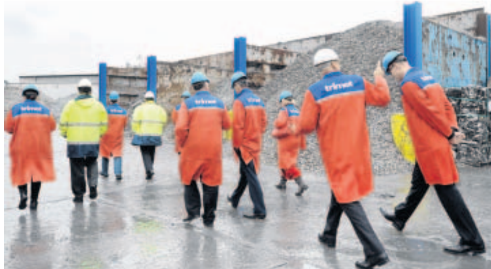
Betriebsrundgang vorbei an Bergen aus Alu-Schrott: Bis zu 7000 Tonnen Recyclingmaterial lagern auf dem Hof des Trimet-Werks am Standort Am Stadthafen.

Primäraluminium ist Trimet der bundesweit größte Produzent. Das Gelsenkirchener Recyclingwerk übernahm Trimet 1993 aus der Insolvenz der Sommer-Gruppe. Gegründet wurde es 1936 von Hermann Jacobs, 1972 von Klöckner gekauft.